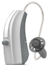
TABLA DE COMPATIBILIDAD